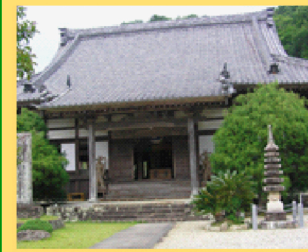
2 : 医王寺