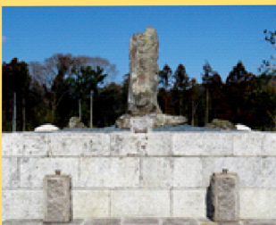
(5) 鳥居強右衛門の墓