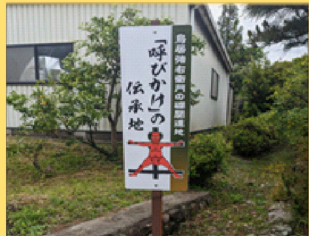
(1) 強右衛門叫びの地