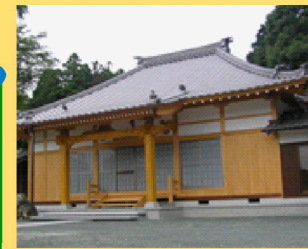
1 : 大通寺