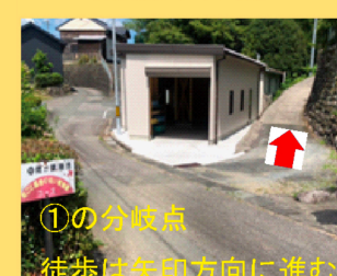
①の分岐点 徒歩は矢印方向に進む