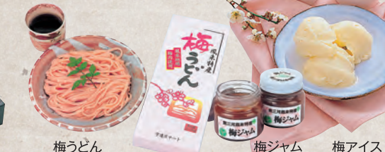
梅ジャム 梅アイス

鳳来地区は、県内一の梅の産地。いろいろな梅の食品があるよ。体に優しい梅をお土産にどうぞ。