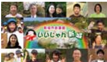
▲画像はイメージです。