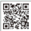
▲アンケートフォーム