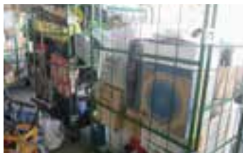
▲回収したリユース品の一部

第2回の開催も予定していますので、リユース活動に取り組んで、ごみの量を減らしていきます。