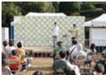
▲わきゃっぴ祭での事例報告

そのほか、滞在中は若者議会の傍聴や市内中学校・高校での交流、ユース会議、8月のアライアンス会議の報告会、鳳来寺山観光などのプログラムに参加しました。