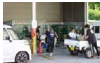
▲イベント時の様子

来場者数 89人 集まったリユース品 1645kg これだけ「ごみ」の 量が減りました!