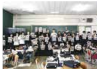
▲市内中学校での交流