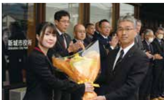
▲職員に出迎えられ花束を手にする市長