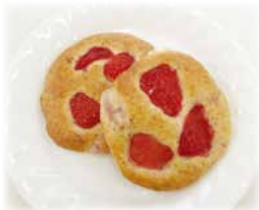
レシピ：農村輝きネット・しんしろ