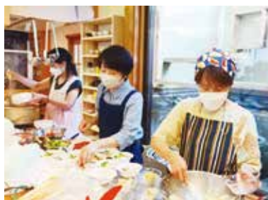
▲子ども食堂のお手伝い

◆ 生活環境の調整：刑事施設や少年院に収容されている人が釈放されたときに、更生に適した環境で生活できるように、釈放後の住まいや就職先などの調査や家族との話し合いなど、受入態勢を整えるための活動を行います。