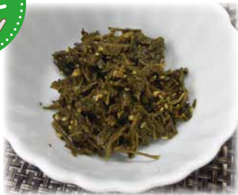
普段は廃棄してしまう部分などを活用したエコレシピです。