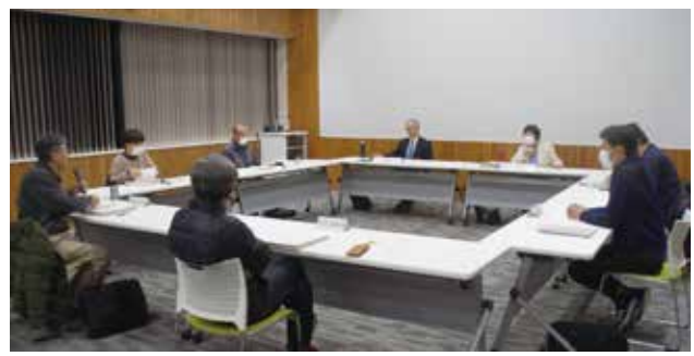
▲ 令和5年度市民自治会議の様子

ることになります。この間、自治基本条例によって、市民自治が進化したかどうかを市民自治会議を通じて垣間見ることができました。 この条例を制定するまでには、多くの市民の方の話を聞き、そして、「条例を制定して終わりではない」という理念があったと聞いています。今はどうか?もう一度、その原点に立ち返り、「市民役のまちづくり」について、市民、行政、議会が本音で話し合うことが重要だと感じています。