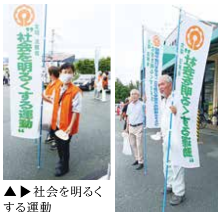
▲▶ 社会を明るくする運動

保護司会に所属する保護司は、犯罪や非行をした人の立ち直りを地域で支える民間のボランティアで、身分は、法務大臣から委嘱された非常勤の国家公務員です。民間人としての柔軟性と地域の実情に通じているという特性を生かして、国の職員である保護観察官と協働して活動します。