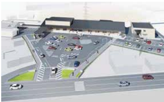
▲鳳来総合支所完成イメージ図

来総合支所第1駐車場を10月7日（木）に閉鎖したことに伴って、鳳来保健センターおよび中央高齢者生きがいセンターは利用できません。なお、シルバー人材センターが指定管理を行なっている中央高齢者生きがいセンターの機能は旧鳳来総合庁舎内に移転しました。（営業時間、電話番号およびファックス番号に変更ありません）