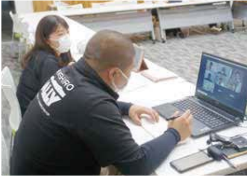
▲オンラインで実施

今回の市民まちづくり集会の目的は、「参加者の夢を叶えるためのヒントや鍵となる意見を出し合うこと」です。集会では、7つのグループに分かれ、実行委員が務めるファシリテーターの進行により、グループワークを行いました。集会で出た夢とアドバイスを一部紹介します。