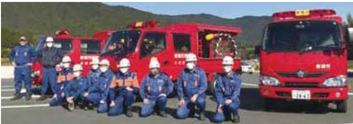
▲最新の消防車 (令和2年度購入)

消防団員と消防車は、自分の住む街、自分の働く街の安心と安全を災害から守るための活動を続けています。