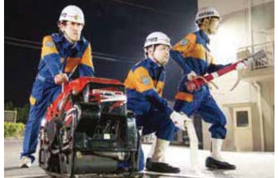
▲積載されている資器材。