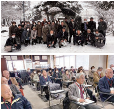
▲長野刑務所研修の様子

渡り廊下で結ばれつつ同時に開かない二重扉の前室で区切られた收容居室棟、運動訓練施設、刑務作業施設などを視察。受刑者の属性で分けられた作業施設内は作業中で温かく、收容居室は留守中で暖房はほぼ無くも改修中の吹きさらし通路を通り入った私たちには温かく