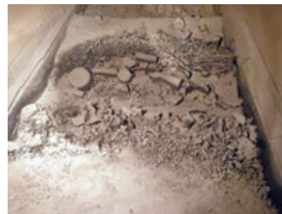
▲焼却炉内で燃えずに残った不燃物