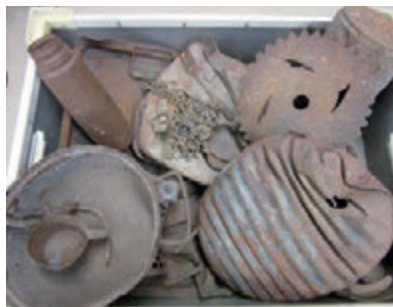
▲水筒、湯たんぼなどの金属