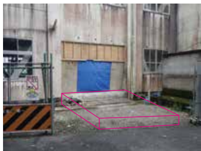
▲プラットフォーム整備

令和6年9月の共同調理場の稼働に合わせて、受入室を整備するため小中学校の給食室などの改修、増築工事を進めています。 今月は鳳来中学校の工事内容と進捗状況をお知らせします。 鳳来中学校では、教室棟1階の旧音楽室と更衣室の一部を受入室に、2・3階の更衣室の一部をワゴンプール（給食が入った食缶を乗せ、配膳するためのワゴン車置き場）に改修します。 現在は内装を撤去し、新たに小荷物昇降機の設置を主に進めています。