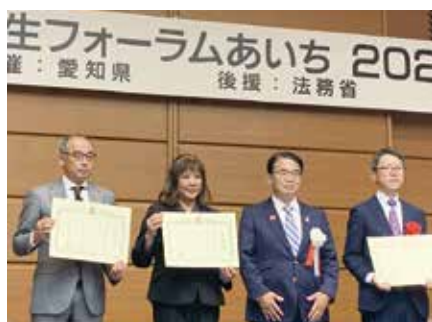
▲ 2022年度のあいち多文化共生月間に行われた多文化共生フォーラムあいちでは、新城市国際交流協会が多文化共生推進功労者として表彰されました。