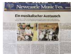
▲ ドイツの地元新聞にも掲載されました