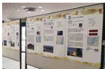
▲ ニューキャッスル展