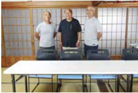
▲下吉田区(椅子、テーブル)

下吉田区では、椅子とテーブルの整備、中市場区自治会では、カーテンやプロジェクターなどを整備し、地域の様々な会議や行事に活用しています。