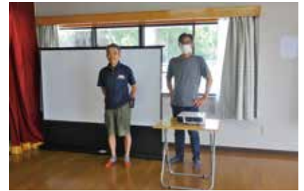
▲中市場区自治会(カーテン、プロジェクター、スクリーン)

備品を整備したことで、地域活動の充実が図られ、活動の更なる活性化が期待されます。