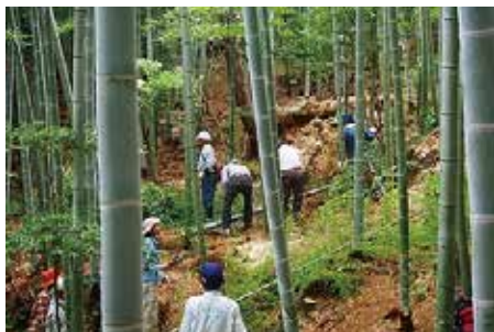
▲「とよかわ里山の会」活動の様子

「とよかわ里山の会」が東三河ふるさと公園で行う環境保全活動について、体験を通じて楽しみながら学び、交流します。当日は桜ヶ丘ミュージアムと豊川稲荷界隈商店街にも寄ります。