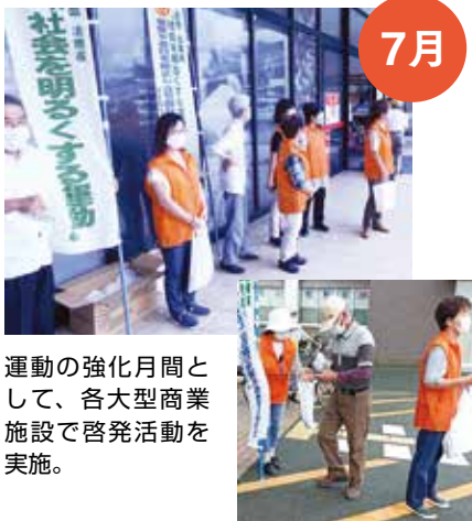
7月 運動の強化月間と して、各大型商業 施設で啓発活動を実施。