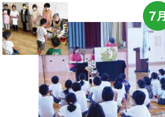
7月 各地区こども園に、更生保護女性会が中心 となって「ありがとうハット」を贈呈。