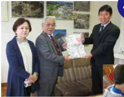
4月 小学校へ、新入児童に持ち方君 (鉛筆の正しいにぎりかたのための 補助器具)の贈呈。

この運動に関して、保護司会や 更生保護女性会では毎年街頭啓発 活動をはじめとして様々な取り組 みをしています。特に未来を担う 子どもたちに共感を広め幅広く 理解を深めてもらうための活動を行 っています。