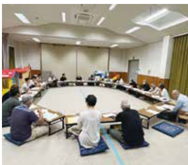
▲ 地域協議会の様子

その中から地域協議会だけでは解決できない課題があることを知り、区長さんを始め温かい地域の皆さんの後押しもあり、地域住民主体で課題やその解決方法を話し合い、仕組みを考える「舟着井戸端会議」を立ち上げ、舟着地域がより良い未来となるよう歩みを進めています。