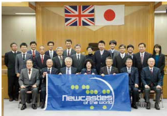
▲ 2017年に新城市を訪れたとき