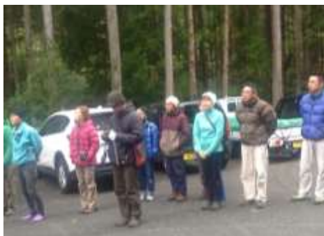
「鳳来の岩場清掃実行委員会」

功させるため、また、定着させていくために、団体や事業所の方々にもイベントに対する理解を求めながら進めていきます。