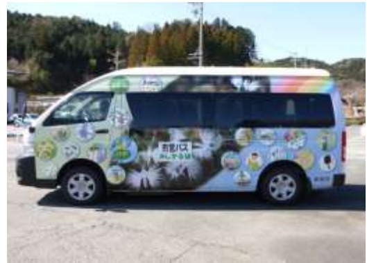
つくであしがる線ラッピングバス

現在4台のラッピングバスが市内を走っており、どのバスも地元みなさんに親しまれ、小中学生の通学や高齢者の通院・買い物の足として活躍しています。