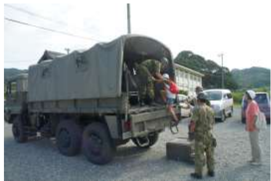
八名中学校で行われた総合防災訓練の様子

市内全地域に自主防災会が141団体組織され、地域に密着した活動が展開されています。それぞれの防災会では、防災会長、防災専門員を中心として防災訓練や災害備蓄品の整備などを実施しています。過去の大規模災害の例を見ても、自主防災会の果たす役割は重要であり、特に救助活動、災害時要援護者の避難支援・安否確認などの初期対応にはなくてはならない存在です。