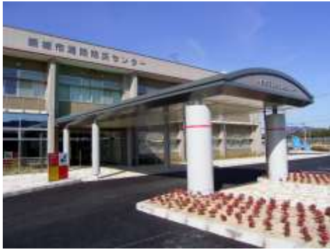
新城市消防防災センター（平井地内）