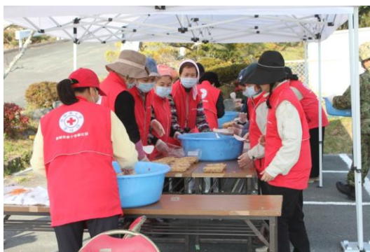
炊きだし訓練の様子

自主防災会では、防災会長、防災専門員を中心に消火班、情報班等の班が編成されており、組織的な防災活動が図られています。