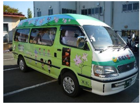
北部線ラッピングバス

平成21年度は、鳳来地区の塩瀬線に鳳来西小学校の児童全員の絵を、また平成22年度には新城地区の北部線にバス通学をしている東郷東小学校児童の絵をラッピングしました。鳥や魚、地域の歴史を描くなど乗ることが楽しくなるバスになりました。作手地区の守義線、つくであしがる線とあわせて4台のラッピングバスが市内を走っています。どのバスも地元みなさんに親しまれ、子どもたちの通学や高齢者の通院・買い物に活躍しています。