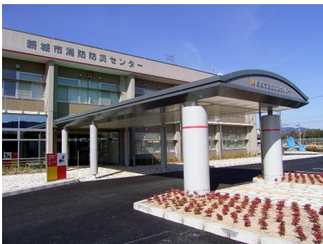
新城市消防防災センター（平井地内）

消防防災センターの1階に「防災学習ホール」が整備され、平成20年4月から一般市民向けにオープンしました。この防災学習ホールは、市民の皆さんが自分の住む地域、そして「我が家」が災害時にどのような状況に置かれるのかを学び、災害への備えを日常生活で実践するきっかけを提供しています。