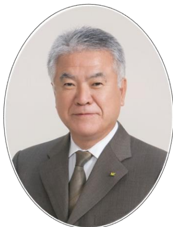
新城市長 穂積 亮次