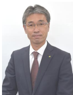
新城市長 下江 洋行

市職員の仕事は、すべて市民の幸せを願って行われます。その仕事で給与を受け取り、生活を支えます。ですから市民のため、地域のために骨を折ってみたいと思う人にとっては、うってつけの仕事です。