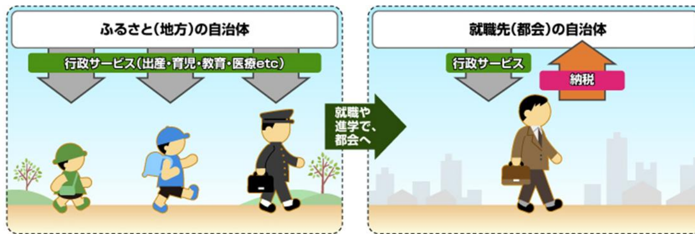
図：総務省HPより抜粋

ふるさとと納税とは、生まれたふるさとや応援したい自治体に寄付ができる制度です。 寄付することで、あなたが住んでいる自治体の住民税の減額（控除）や税務署から所得税の払い戻し（還付）を受けられます