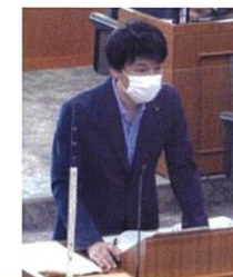
令和4年6月定例会 6月16日 一般質問