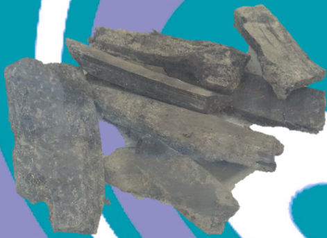
炭化物(竹材)／長篠城址史跡保存館所蔵

時は室町後期、今川氏・松平氏・織田氏・武田氏によって幾度も侵攻されてきた三河領土には、境目の要衝として長篠城がありました。争いが絶えない動乱の時代、その渦中に巻き込まれた長篠城と縁ある大名や国衆たちのストーリーに迫ります。