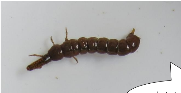
▲ヒゲナガカワトビケラ