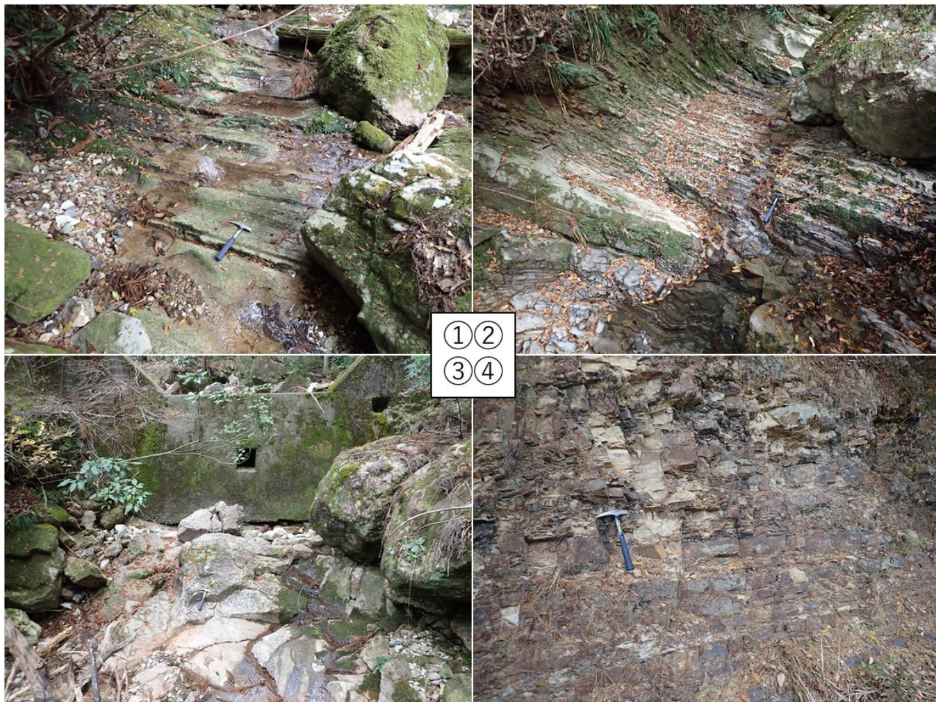
①表参道石段登り口周辺 火山砕屑岩露頭 ②同 海成層露頭 ③真増寺奥 火山砕屑岩露頭 ④旧鳳来寺高校裏 海成層露頭