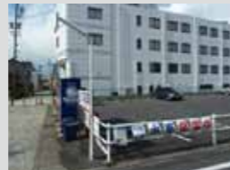
④中山道美術館北側