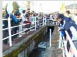
②恵那文化センター前 (2機)