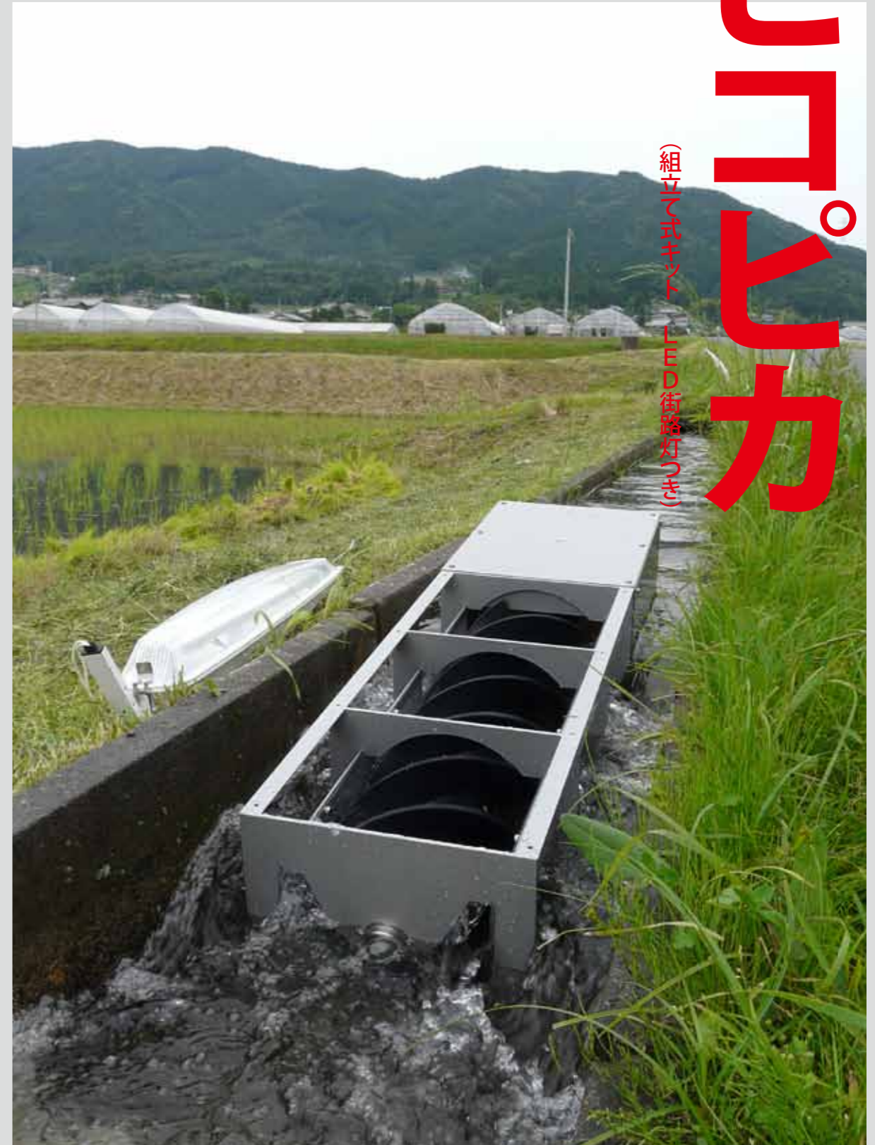
(組立て式キット LED街路灯つき)