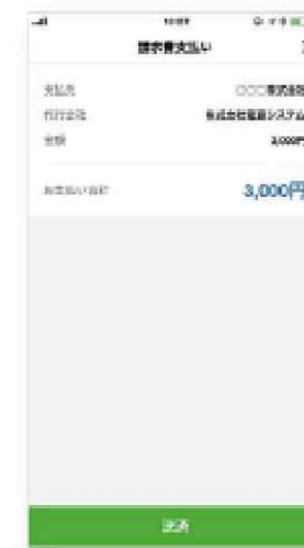
④ 請求内容を確認する