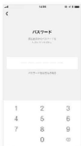
⑥ パスワードを入力する