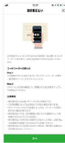
② 案内を読んで[次へ]