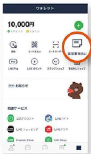
① [請求書支払い]をタップ