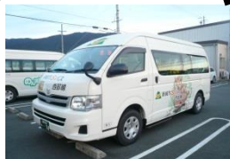
つくであしがる線