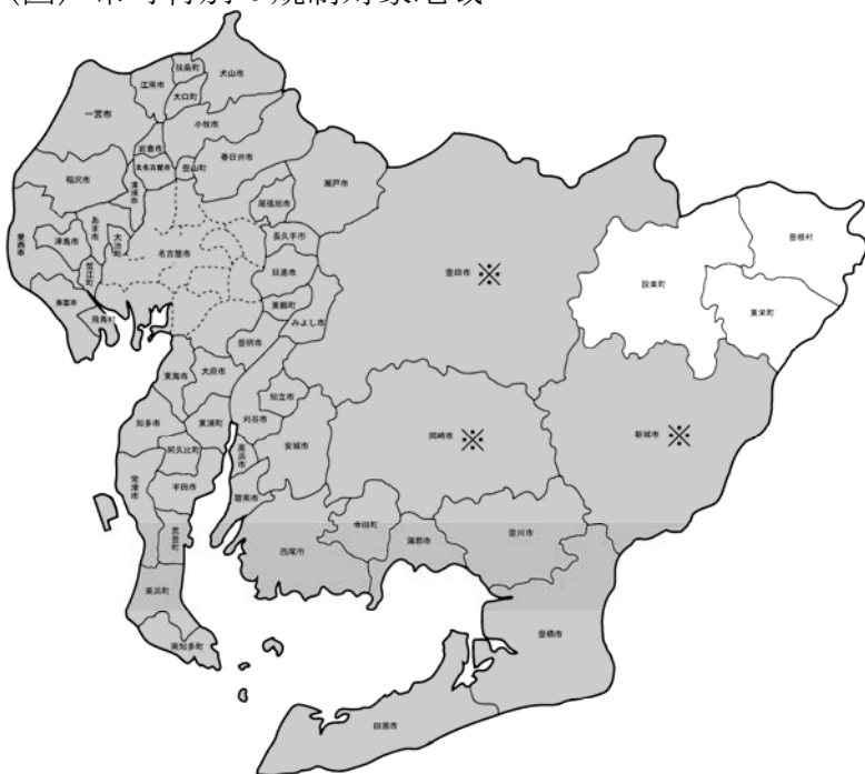
(図) 市町村別の規制対象地域

北設楽郡の設楽町、東栄町及び豊根村を除く県内市町村の、都市計画法の「工業専用地域」及び「都市計画区域以外の地域」を除く地域 (※) が規制対象となります。