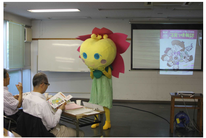
<審査会（公開プレゼンテーション）の様子>