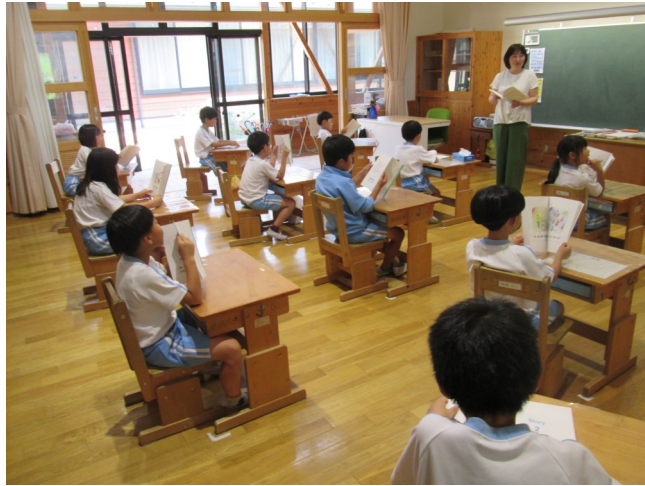
小学校での英語遊び