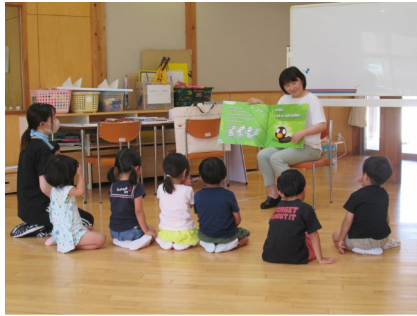
こども園での英語遊び

また、3、4年生の外国語活動及び5、6年生の外国語(英語)の授業では、教員を支援するアドバイザーを派遣し、指導方法について共に考えていきます。