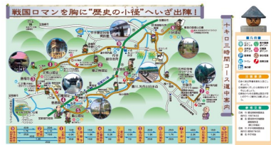
パンフレット裏紙の上部