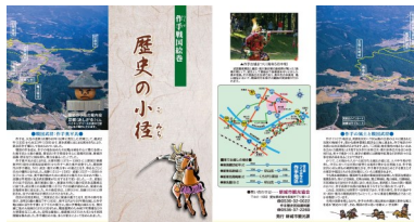
パンフレット表面の上部

歴史の小径パンフレットは多くの方に手に取っていただいております。残りの部数が少なくなっています。パンフレットは前回増刷してから数年が経過しているため内容を見直し、修正をして増版を行います。