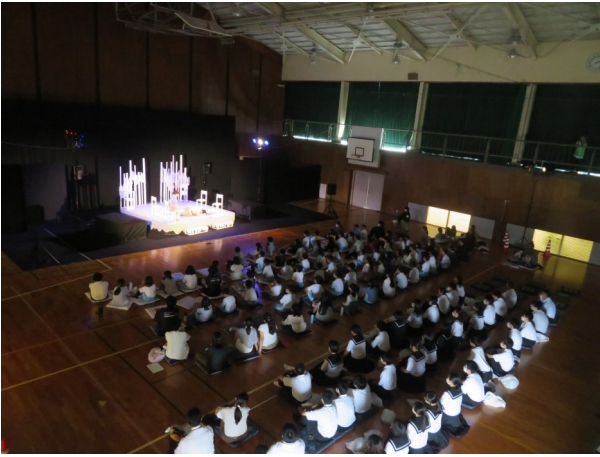
今年の様子「劇団うりんこ」を鑑賞

来年度は、総合劇集団俳優館によるミュージカル「あらしのよるに」の鑑賞を企画しています。