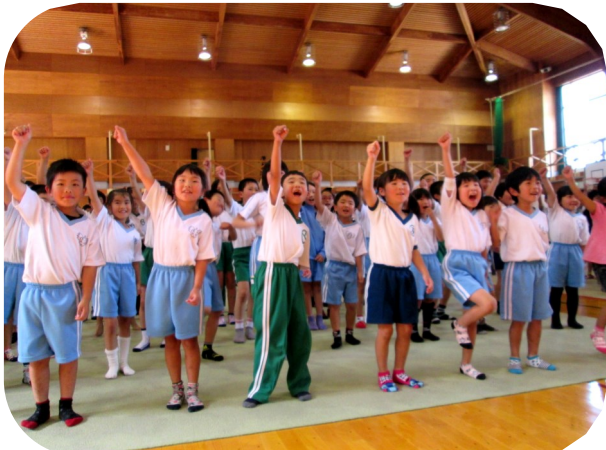
ボディーパーカッションに挑戦♪

小中学生は、受付や会場案内、司会進行から片付けまでを分担して行いました。また、交流タイムでの演奏体験も行いました。「1秒間に16打のテクニク」、「1日10時間の練習」。妙技をふるう演奏の背景にある「努力の大切さ」を知つ