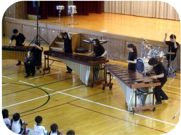
プロによる迫力ある演奏♪