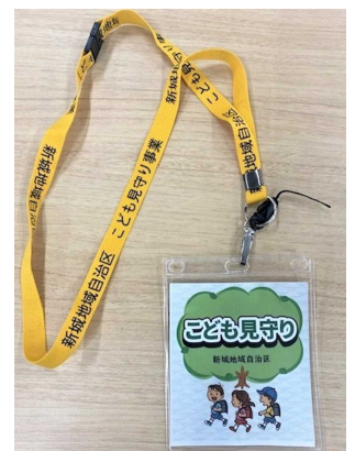
こども見守りボランティア実施者証