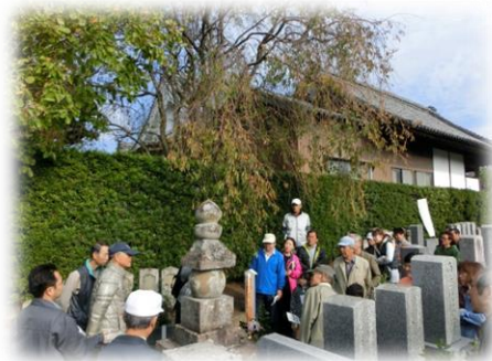
大善寺・亀姫の墓見学の様子