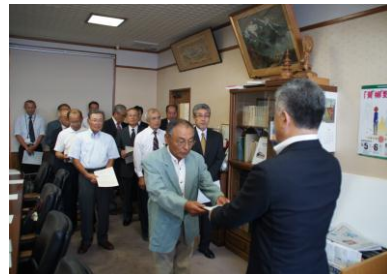
会長から市長へ 建議書を提出しました。 (平成 25 年 10 月 11 日)