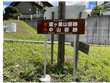
長篠の戦い史跡案内看板 (本久地内)