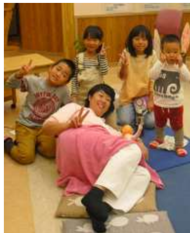
家族みんなで参加する ややMAGIWA (出産準備教室)