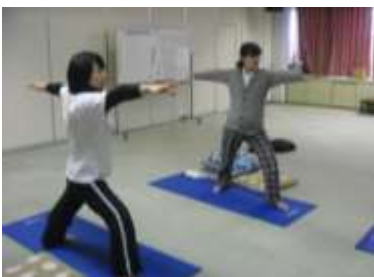
マタニティ・ヨーガ