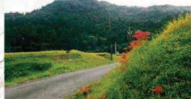
鳥原から風切山を望む

豊川本流をはさんで北に雁峰山、東に舟着山と対峙しており、東西に長く尾根を張り出した山容。冬の設楽原を吹抜ける風はここで切り分かります。