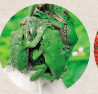
市のカエル モリアオガエル