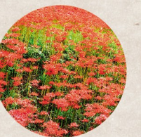
彼岸花の群生 (市内各所)