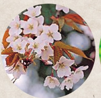
市の木 ヤマザクラ