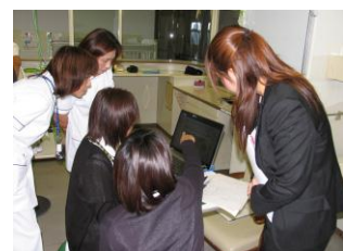
電子カルテ導入リハーサルの様子

導入後しばらくの間、システムの切り替え作業や操作に不慣れなため、診療や会計などの待ち時間が長くなることがあります。