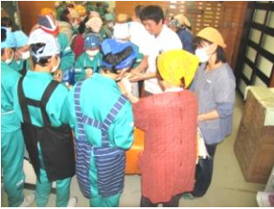
講演後、生徒と五平餅をつくり一緒にいただきました