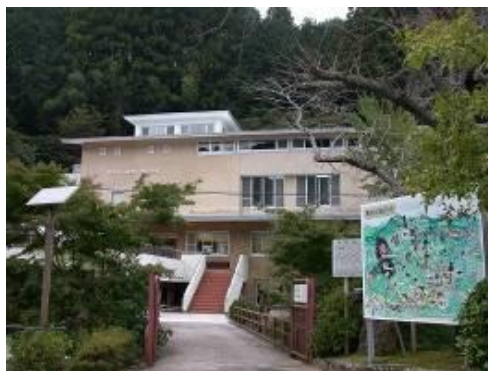
鳳来寺山自然科学博物館

また、県内最大規模の植物標本を収蔵するなど、自然資料の収集保存活動も行っています。