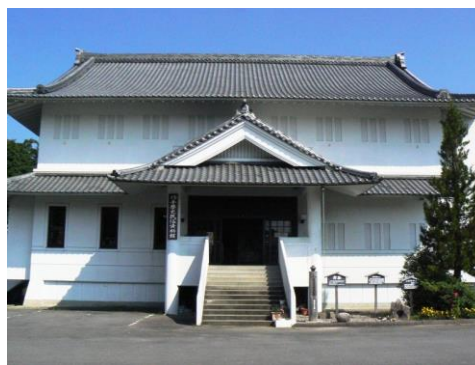
作手歴史民俗資料館

作手歴史民俗資料館には、こうした風土の中で育まれた人々の歴史、民俗や湿地についての資料が集められています。