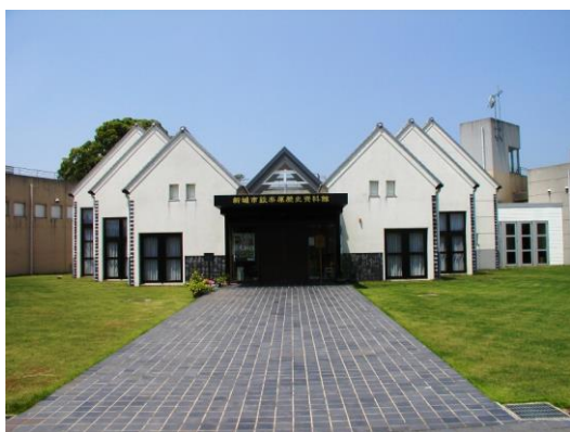
設楽原歴史資料館

また、設楽原歴史資料館には、日本開国の基となった幕末の日米修好通商条約調印の立役者・岩瀬忠震についての資料も展示しています。