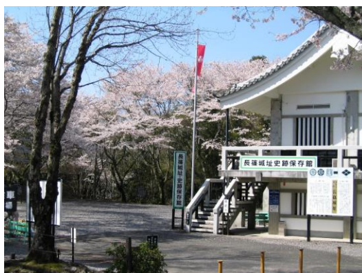
長篠城址史跡保存館