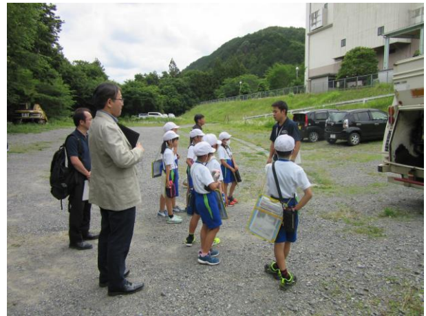
資源集積センター見学の様子