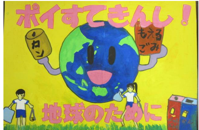
平成30年度金賞作品