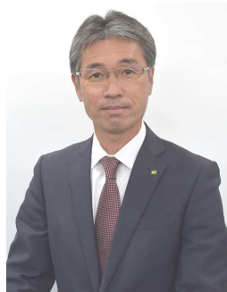
新城市長 下江 洋行