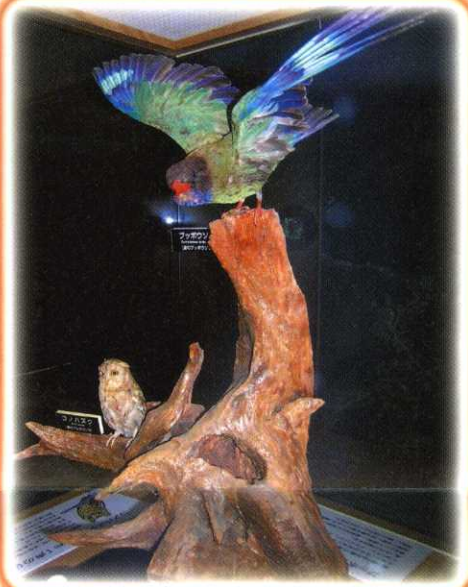
コノハズクとブッポウソウ Scops Owl & Dollarbird コノハズクが鳴く姿を映像で 見ることができます