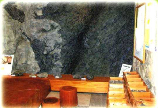
日本最長の断層帯 中央構造線 Median Tectonic Line