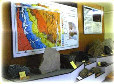
鳳来寺山の地質 Rocks forming Mt. Horaiji