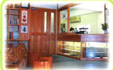
受付 ミュージアムショップ Reception & Office Museum Shop