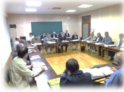
平成 27 年度地域協議会委員は次号で紹介させていただきます。