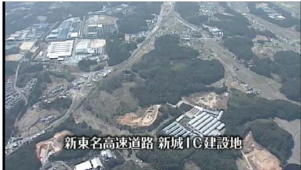
新東名高速道路 新城IC建設地