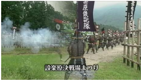
設楽原決戦場まつり