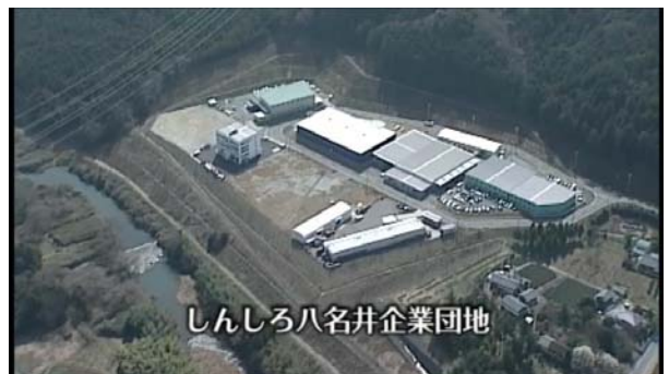
しんしろ八名井企業団地