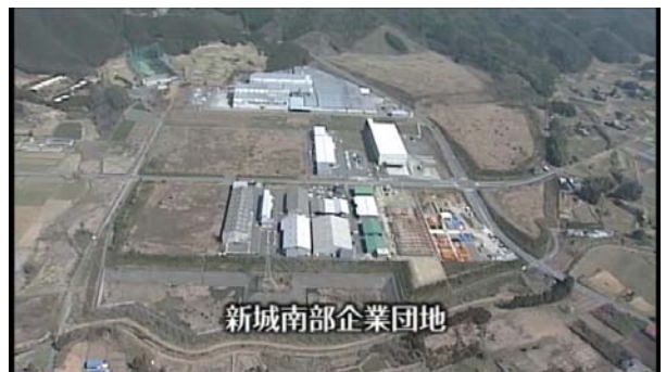
新城南部企業団地