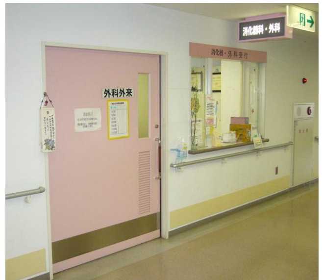
外科・消化器科 診療表