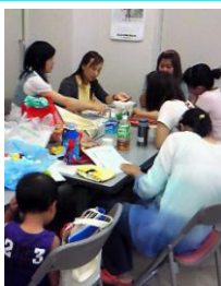
どうしたらうまく伝わるかな