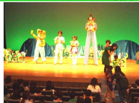
↑ なつきーコンサート

これからも、幼児の文化と子育ての楽しさを支えていく活動をしていきたいと思っております。