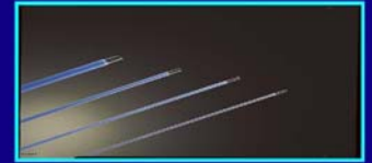
Forward fire fibers