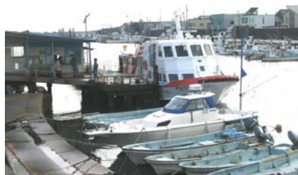
↑ 一色渡船場 (所要時間約 30 分)